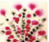
Gaby FRAPPE DALLE